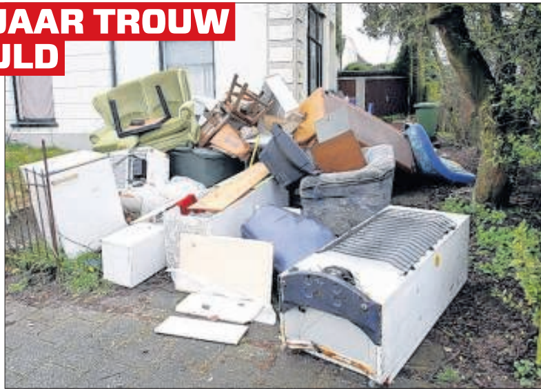
Een huisuitzetting is een drama.

Hoewel Ron sinds de zomer met kunst- en vliegwerk aan de betalingsregeling wist te voldoen, liep de schuld toch op door hoge rentes en executiekosten. Elke maand stond het incassobureau met een dwangbevel à 160 euro aan de deur. Ron